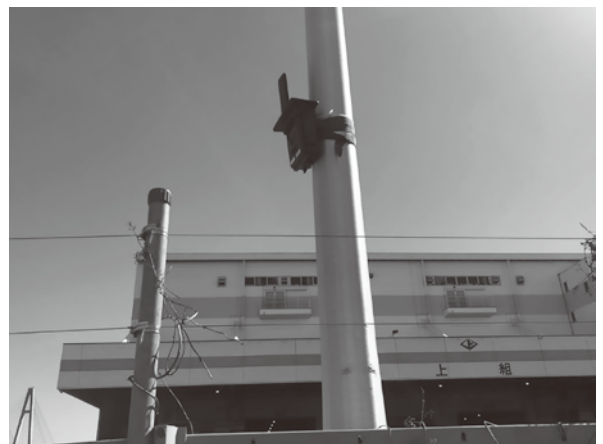
名古屋港国際総合物流センターに設置されたトレイルカメラ

いま順次作業を進めていますので、設置要望を出された事業所さんにおかれましては今しばらくのご猶予をください。