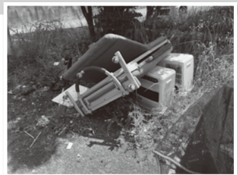
ゴミ集積所に捨てられたストーブやソファ