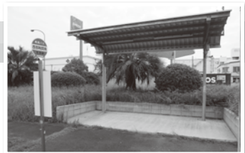
飛島バス停完成予想図

飛島地域交通活性化法定協議会において、西部臨海地帯企業連絡協議会の要望に基づいて、「第二桜木大橋南A」のバス停に屋根が設置されることになりました。名古屋港管理組合・県尾張事務所への申請が済み次第工事に入り、11月末までには完了する予定です。