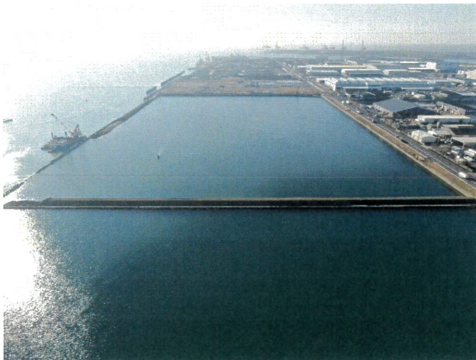
【護岸整備(築堤)の様子(令和2年度)】