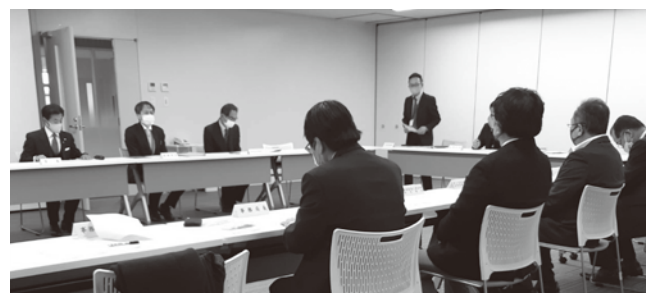
弥富市長との懇談会

また、楠地区の信号機の設置、中央分離帯の改良や暴走族対策のためのキャッツアイの設置などにつきましては、道路管理者である名古屋港管理組合の所管になりますので、弥富市より要望事項はお伝えします。などのやり取りがありました。