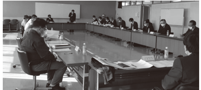
飛島村臨港地区連絡協議会との懇談会

平成30年の要望を受け「税関南」に屋根を設置して以来、屋根を設置できるバス停の検討を進めています。これまでに名港線のすべてのバス停を確認し、屋根の設置が可能な候補地を調査しています。令和3年度に1箇所の設置が可能となるよう予算の確保に向けて調整しています。名古屋駅バスセンターへの乗り入れは、許可が難しい旨の情報を得ていますが、令和元年度の回答と同様に名古屋駅までの直行バスを新設することで利便性の向上に加え課題の解決ができる可能