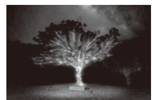
(イルミネーションイメージ)