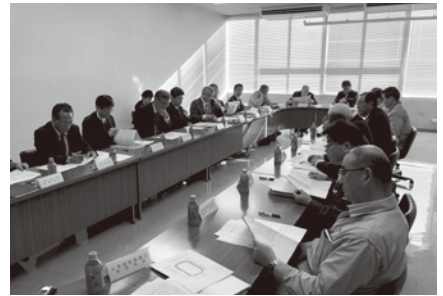
飛島村臨港地区連絡協議会との懇談会

また12月20日（金）には飛島村公民館分館で飛島村長を始め国土交通省名古屋国道事務所、蟹江警察署、名古屋港管理組合の方々との懇談会が開催され、ゴミ収集においてカラス対策やごみの散乱防止対策、バス停の改修、梅之郷の渋滞解消対策、名古屋税関西部出張所前の歩行者信号の設置などについて話し合われました。（詳細はまた別途報告します。）