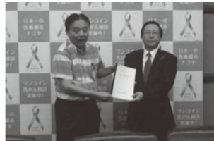
(名古屋市 河村市長)