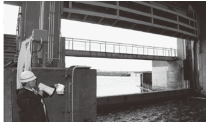
貯木場閘門閉鎖訓練