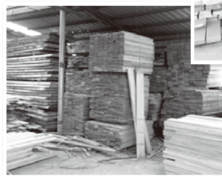
大連でのタモ板の検品の様子