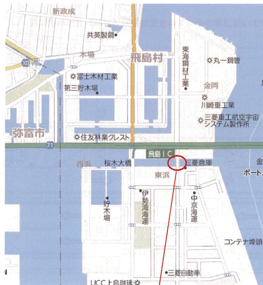
第2桜木大橋 (愛知県海部郡飛島村木場～東浜間)